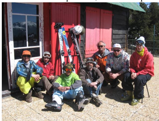
Devant le chalet du club